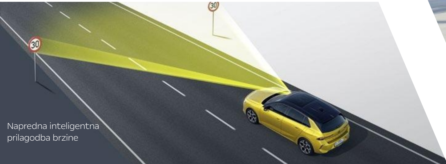
Napredna inteligentna prilagodba brzine