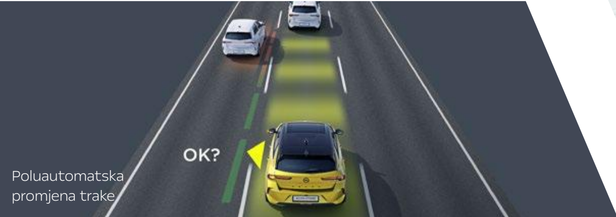
Poluautomatska promjena trake