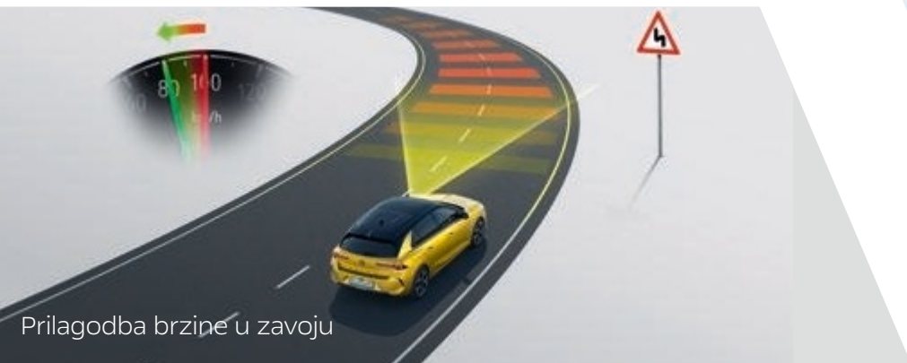
Prilagodba brzine u zavoju